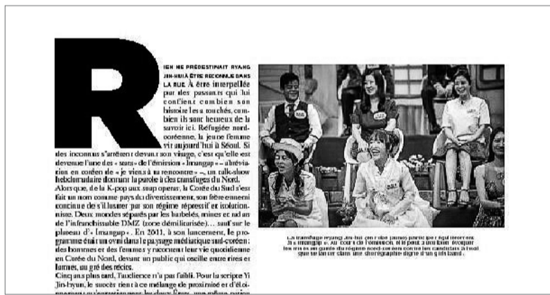
르몽드 매거진에 소개된 ‘이만갑’ 기사.