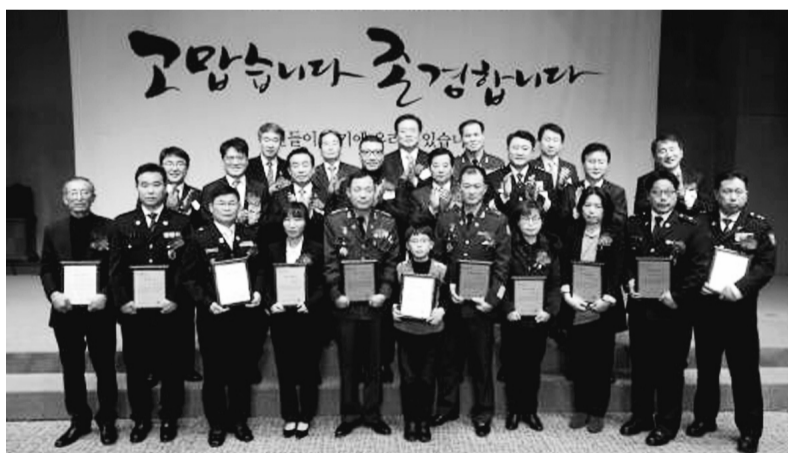
1월 12일 서울 중구 한국프레스센터에서 열린 제6회 영예로운 제복상 시상식에서 수상자들이 기념사진을 찍고 있다.

‘제6회 영예로운 제복상’ 수상자 11명 선정 천안함 폭침 사건 등 계기로 義人 존경 사회 조성에 나서