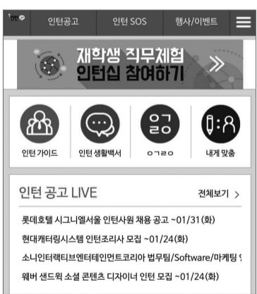
청년 인턴 전문 모바일 앱 '청년드림 인턴UP'의 화면.

청년드림센터는 '인턴UP' 첫 사업으로 고용노동부와 함께 인문·사회·예체능 계열 대학 2,3학년생을 대상으로 직무 체험 인턴 희망자 1000명을 선별해 기업과 연결해주는 사업을 시작했다. 고용부가 제정한 '인턴 보호 가이드라인'(현장·휴일·야간 근무 못하게 막는 내용)을 적용하고 대상도 대학 2,3학년생으로 제한했다. 취업용