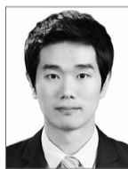
최선 / 채널A 보도본부