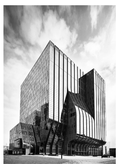
새로운 제작 허브로 떠오른 상암동 DDMC.

채널A의 ‘상암동 시대’가 막이 올랐다. 지난 1월 제작본부 제작 1,2,3팀과 신설된 채널A B&C, 미디어텍 일부가 상암동 동아디지털미디어센터(DDMC)에 입주하면서 DDMC가 채널A의 제작센터로서 본격적인 역할을 시작한 것이다. 상암동 시대 개막으로 콘텐츠의 질 향상이 기대된다. 최첨단 시설과 장비들이 들어찬 DDMC에서 촬영, CG, 자막 등 모든 제작이 ‘원 스톱’으로 이뤄지기 때문이다. 제작시간도 단축된다. 특히 제작 프로그램의 CG, 자막 등 비주얼을 담당하는 채널A B&C가 미디어텍과 함께 제작 프로그램의 완성도를 더욱 높일 것으로 보인다. 제작 관련 부서들이 모여 있게 되면서 대내외 소통에도 긍정적 영향을 미칠 전망이다. 특히 방송사들이 밀집해 있는 상암동의 지리적 특성상 방송계 소식과 트렌드를 쉽게 접할 수 있게 됐다. 윤정화 제작본부장은 “상암 이전으로 제작본부 구성원들의 사기가 한층 높아졌다”며 “시청자들에게 사랑받는 방송을 만들기 위해 한 발짝씩 더 움직