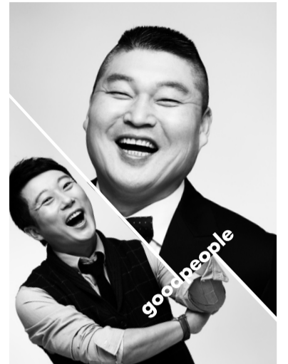
<신입사원 탄생기-굿피플>의 MC로 확정된 강호동과 이수근.

네 남녀의 치명적인 로맨스를 소재로 한 드라마인 만큼, 다양한 장르에서 폭넓은 연기로 사랑 받아온 배우들의 연기에 큰 관심이 쏠리고 있다. 박하선은 결혼 이후 3년간의 인방극장 복귀작이어서 더욱 화제를 모으고 있다. 출연진들의 한층 짙어진 감성과 연기력이 만나 어떤 시너지를 완성할지 기대를 모으고 있다.