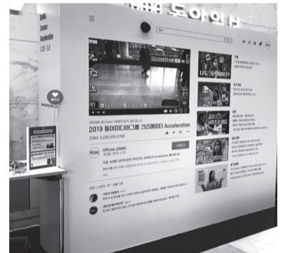
광화문 동아미디어센터 1층에 설치된 <DAMG 크리에이터 Acceleration> 홍보 부스.

선정된 개인 또는 팀에게는 100만 원의 상금이 주어진다. 경영전략실 1·2theC스쿼드 팀과 함께 시범 콘텐츠를 제작해 유통할 수 있다. 자세한 내용은 지니(Genie)에 올린 공지사항을 참고. 경영전략실 2theC스쿼드 권기범