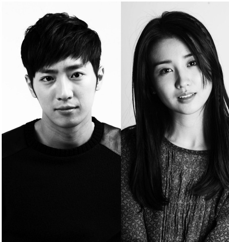
상반기 방영 예정인 채널A 새 드라마 <평일 오후 세시의 연인>의 남녀 주인공으로 배우 이상엽과 박하선, 예지원, 조동혁(왼쪽부터 시계방향)이 확정됐다.

“ <평일 오후 세시의 연인>은 금기된 사랑 때문에 흥역을 겪는 어른들의 성장 드라마