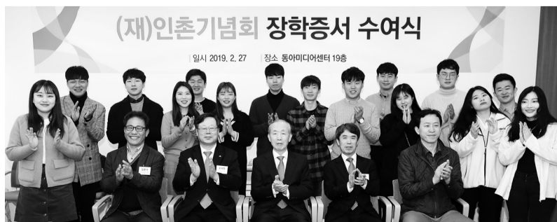
2월 27일 인촌기념회 장학증서 수여식이 끝난 뒤 참석자들이 기념촬영을 하고 있다.