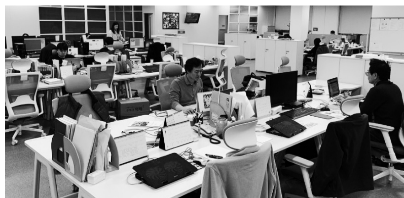
스포츠동아 직원들이 충정로 사옥 10층에 마련된 스포츠동아의 새로운 사무실에서 근무하고 있다.

아사히신문 측은 “4월부터 아사히신문 포토아카이브에서 동아일보 사진에 대한 홍보를 본격적으로 할 예정이다. 그럼 매출액은 늘어날 것”이라고 말했다. 남북 정상회담 등 특별 이벤트가 생길 때 별도로 ‘이벤트 코너’를 만들기로 했다. 편집국 동경지사 박형준