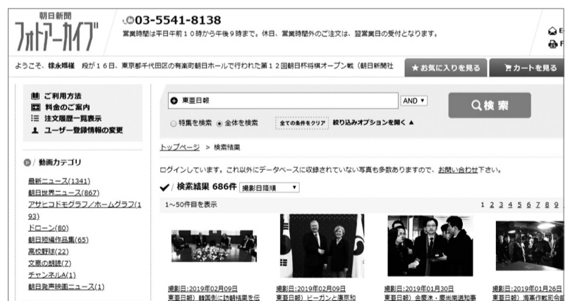
아사히신문이 운영하는 포토아카이브 모습. 시험 판매용으로 올린 동아일보의 사진이 보인다.

동아일보와 아사히신문은 사진위탁판매에 대한 세부 조율을 끝내고 3월 초 계약을 맺기로 했다. 동아일보 사진을 아사히신문 포토아카이브에 올려 일본 미디어와 일반인에게 판매하는 형태다. 판매단가는 아사히신문이 자사(自社) 사진을 판매할 때 적용하는 요금과 동일하다. 예를 들면 방송사가 본방송에 1회 사용할 때 1만9440엔(약 19만7000원), 신문사가 종이신문에 1회 게재할 때 2만1600엔이다. 잡지사는 발행 부수와 사진 크기, 게재 면에 따라 금액이 다르다. 모두 1회 사용 기준이고, 재사용할 때는 추가 금액을 받는다.