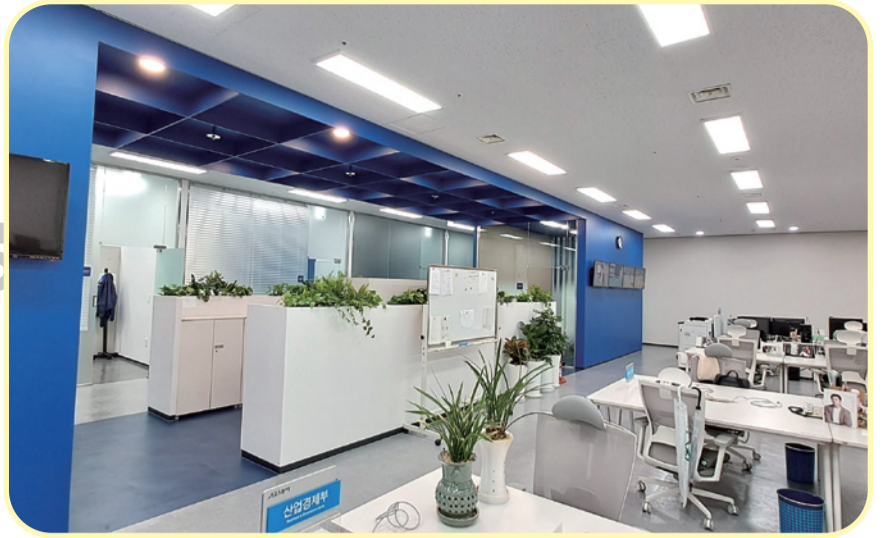
18층 ▲스포츠통아 사무공간

올해 동아E&D, 동아사이언스 입주로 11개 계열사 집결... 9층 공용 회의실도 스마트 멀티룸으로 탈바꿈