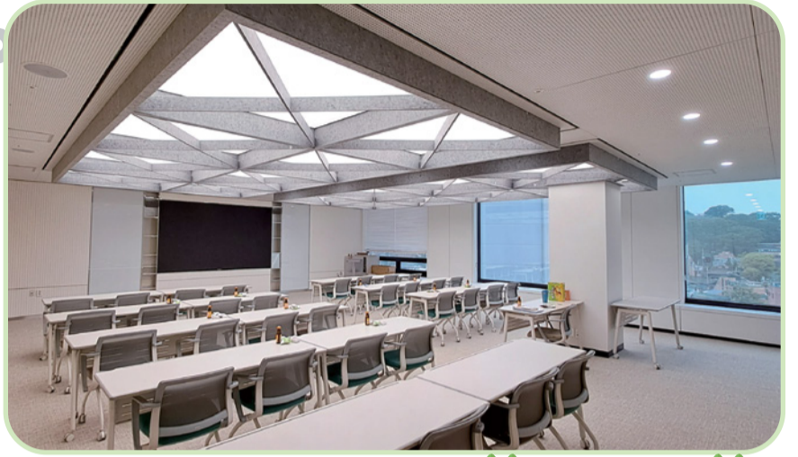
9층 ▲스마트 멀티룸(공용 회의실)