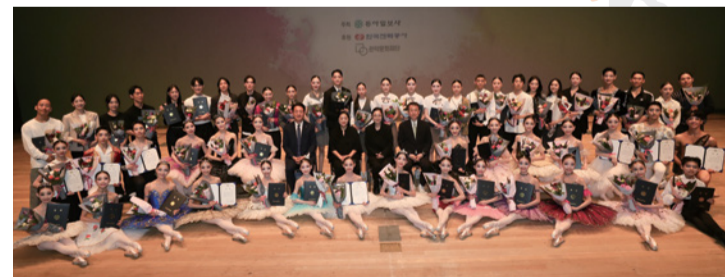
5월 8일 서울 종로구 세종문화회관 대극장에서 열린 제54회 동아무용콩쿠르 본선 및 시상식에서 수상자들이 꽃다발과 상패를 들고 웃고 있다.