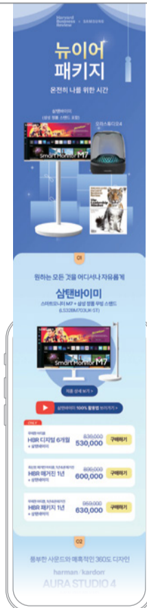
미래연과 마케팅본부의 협업 패키지

'구독경제'의 시대, 신문과 매거진의 구독 경쟁력을 높일 방안은 무엇일까. 동아일보 미래전략연구소(이하 미래연)와 마케팅본부의 협업은 이러한 고민에서 시작됐다. 구독 가능한 다양한 콘텐츠와 서비스가 경쟁 대상이 되면서 구독의 '원조'격인 신문과 매거진의 구독 서비스에도 변화가 요구됐기 때