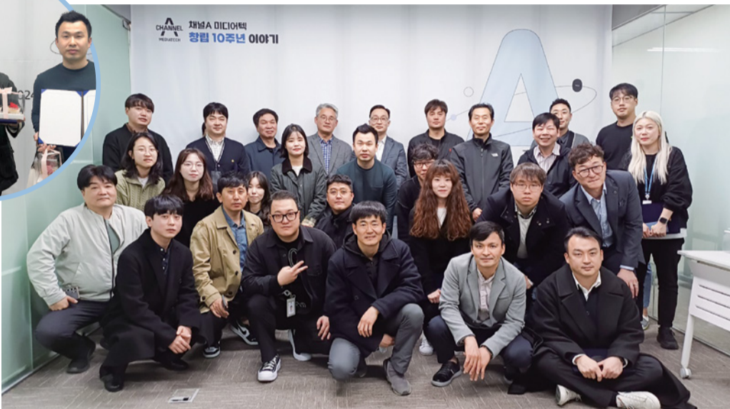
▲ 4월 1일 동아미디어센터 4층 회의실에서 열린 미디어텍 창립 10주년 기념 행사 단체사진.